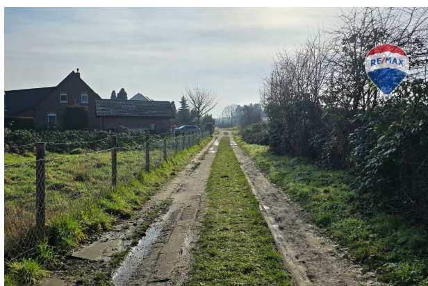
Fuß- u. Radweg (in Planung)