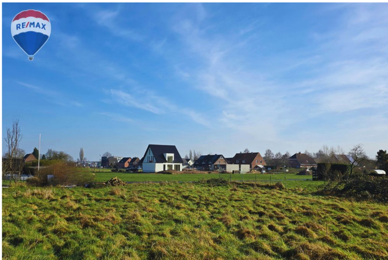
Ansicht Richtung Osten